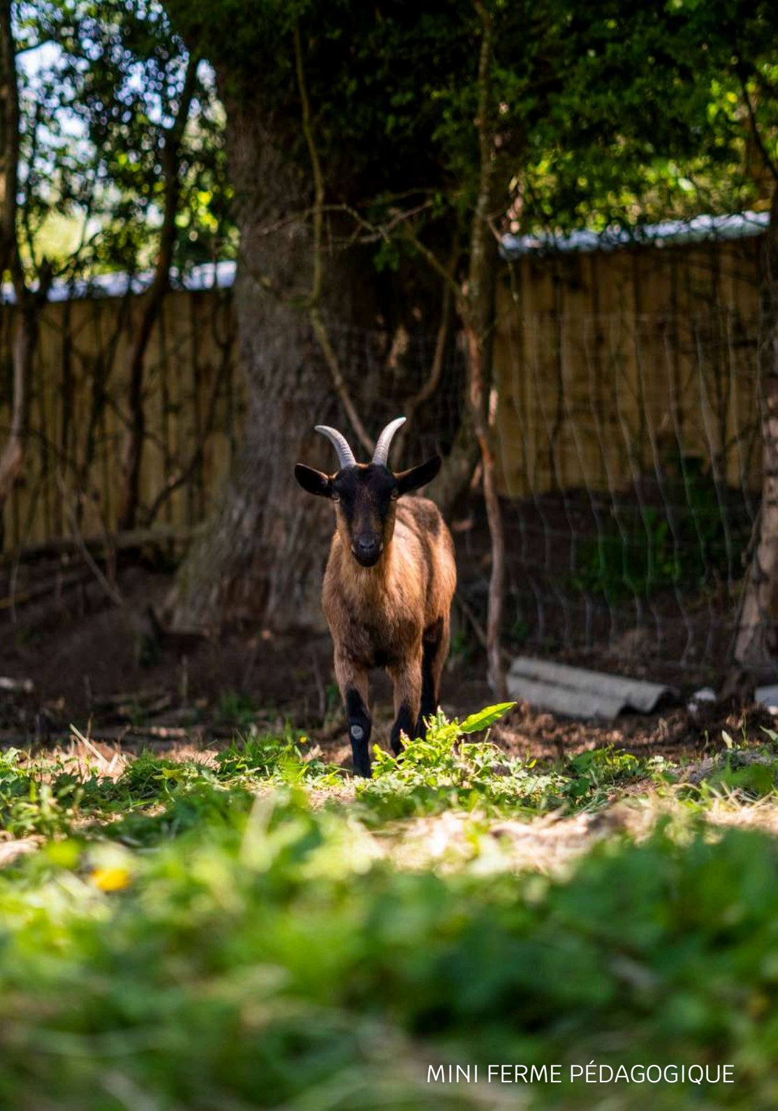
MINI FERME PÉDAGOGIQUE